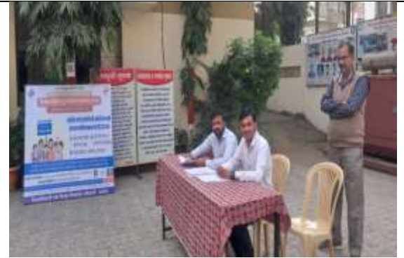
दिनांक १३ एप्रिल २०२४ मतदान जनजागृती कार्यक्रम SVEEP या प्लॅटफॉर्मद्वारे संपन्न: