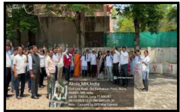
दिनांक १३ एप्रिल २०२४ रस्ता सुरक्षा जनजागृती कार्यक्रम संपन्न: