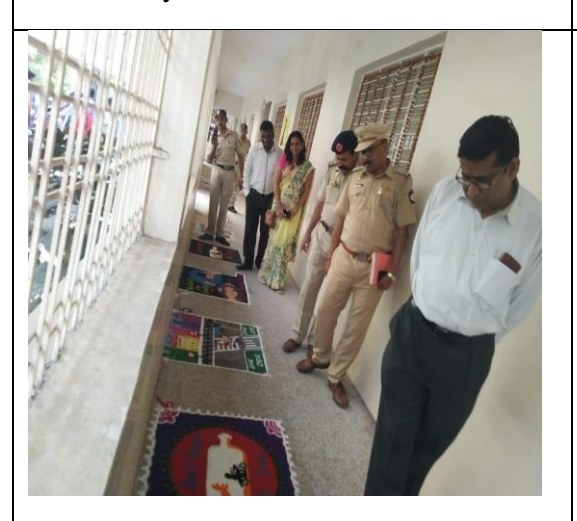
Rangoli Competition on Road Safety