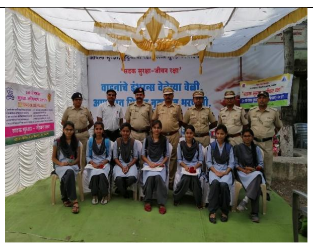
Felicitation of winners of Slogan & Rangoli Competition by District Traffic police office