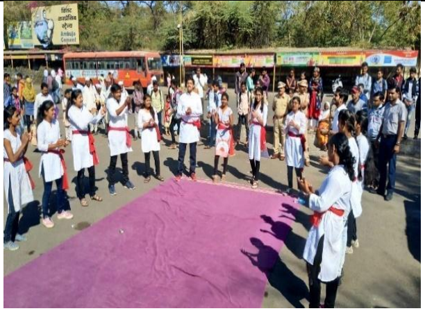
Street-play on Road Safety at public places