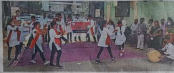
पथनाट्याच्या माध्यमातून कोविड प्रतिबंधात्मक लसीकरणबाबत जनजागृती करताना 'आर.एल.टी.'च्या विद्यार्थिनींनी