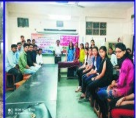
Programme on "Ek Bharat Shreshtha Bharat" Campaign.