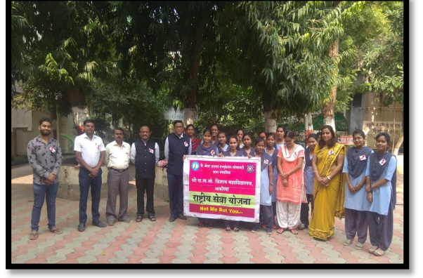
जागतिक एड्स दिवस साजरा करून जनागृतीकरण्या करिता रेड रिबन क्लब ची स्थापना करण्यात आली.