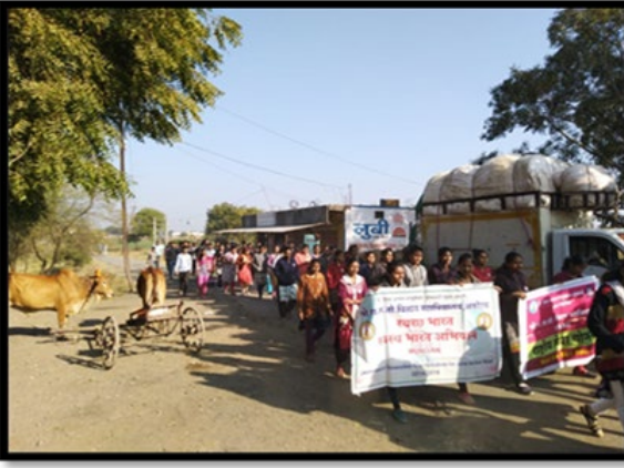
मुनिजन अंतर्गत दत्तक ग्राम आपोती येथे स्वच्छाता अभियान राबवितांना रासेयो चे स्वयंसेवक