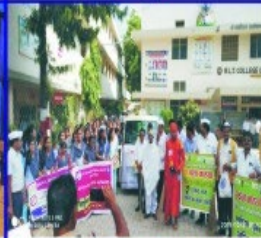
2nd Oct. 19, Plastic Banned from College Campus & Rally for Awareness was Organised in collaboration with Municipal Corporation Akola, the President for the Program was Municipal Commissioner