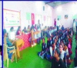
Dept. Of Microbiology, Shri RLT College of Science Akola Organized a Free Blood Group Checkup Camp for 100 Students of School at Gram Apoti Kh.