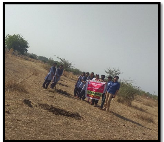
२६/०५/२०१९ रोजी मलकापूर सन-सिटी येथे वृक्षारोपण करण्याकरिता गड्डे तयार करण्यात आले