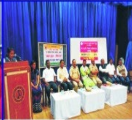
"Road Safety Week" Awareness Programme in Collaboration with "Pradeshik Parivahan Vibhag, Akola".