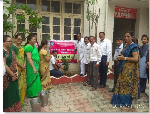
रा. से यो पथक श्री रा ल तो महाविद्यालयाचे प्राचार्य, कार्यक्रम अधिकारी, शिक्षक व शिक्षकेतर कार्माचारी आणि रासेयो स्वयंसेवक वृक्ष लागवड करतांना.