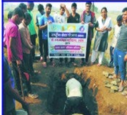
Two Shosh pits of 5 X 5 X 6 Feet were created by NSS volunteers