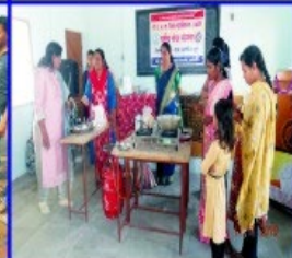
"Mahila Melawa" at Gram Apoti (Kh.), Aaji-cha-Batwa Competition for Women.