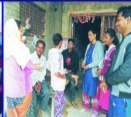
Unnat Bharat Abhiyan Campaign at 5 Adopted Villages