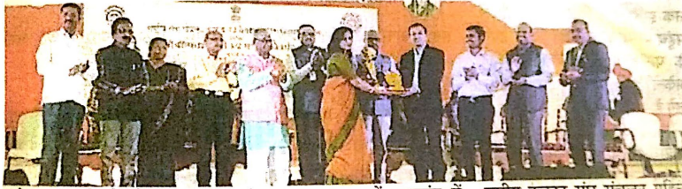
अकोला। 8 फरवरी। लोस सेवा।

हाल ही में उत्कर्ष 2019-20 सामाजिक व सांस्कृतिक स्पर्धा का आयोजन कवयित्री बहिणाबाई चौधरी उत्तर महाराष्ट्र विश्वविद्यालय, जलगांव एवं राष्ट्रीय सेवा योजना, उच्च व तंत्रशिक्षा विभाग मंत्रालय के