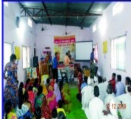
"Motibindu Mukta Gaon" An Eye Checkup Camp For Cataract at Gram Apoti. From All 87 Patients 27 Were Found Cataract Positive and 7 Were Done Free Surgery at Thorat Eye Hospital, Akola.