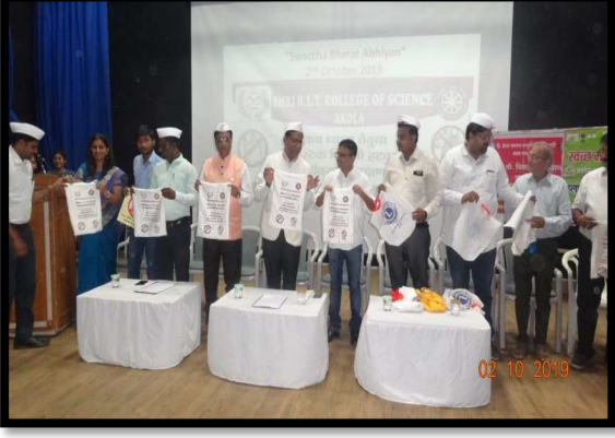
प्लास्टिक पिशव्यांवर संपूर्ण बंदी घालून कापडी पिशव्यांचे अनावरण करतांना मान्यवर