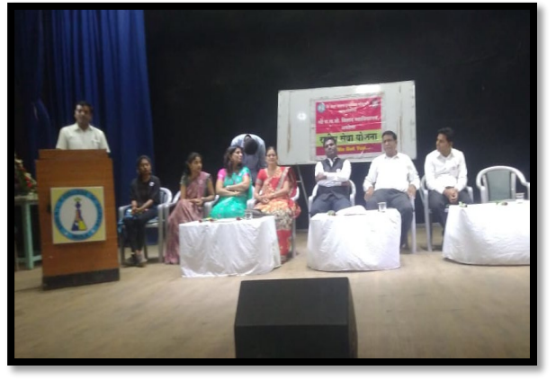
रासेयो चे उद्घाटन प्रसंगी मान्यवर १४/१०/२०१९