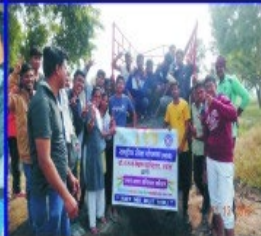
Unnat Bharat Abhiyan: Shramdaan with the help & Cooperation Of Villagers