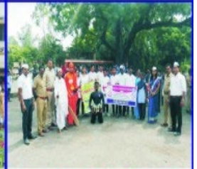
Swacchata Abhiyan and Single Plastic Awareness Street Play at City Bus Stop Akola.