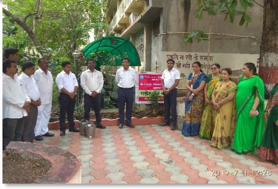
१ जुलै २०१९ रोजी "सन सिटी मलकापूर, अकोला" येथे १३ कोटी वृक्ष लागवड कार्यक्रम राबविण्यात आला.