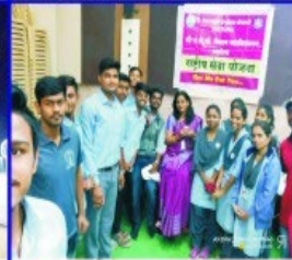
Blood Donation Camp On 24/12/2019