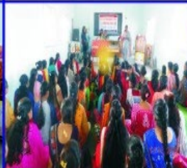
One day Soyabeen Prashikshan & Hands on Training for Developing Skill in Women from Rural Area .