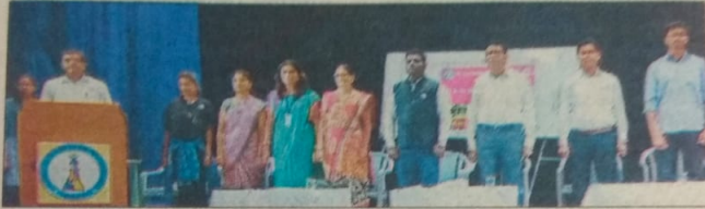
Dignitaries present in the programme.