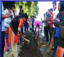
Shramdaan at Adopted Village Apoti Khurd