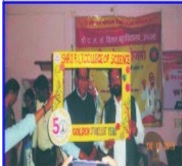
Inauguration Ceremony of NSS Special Camp at Village Apoti Khurd