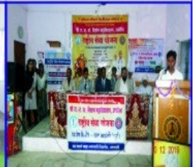
Legal Advisor Workshop by "Jilha Vidhi Seva Pradhikaran Akola"