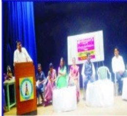
NSS Orientation Program for Newly Enrolled Volunteers on NSS Foundation Day