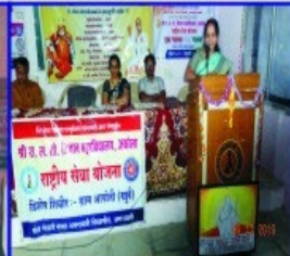
Guidance about Domestic Violence and Posco Act